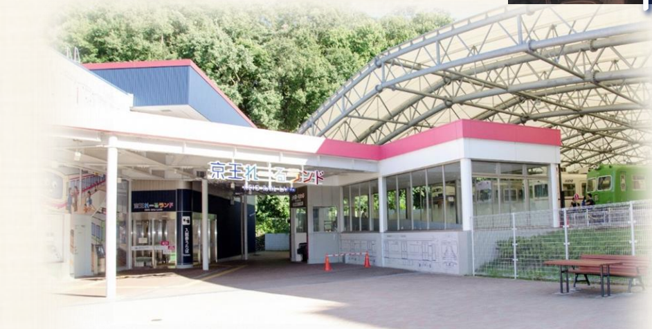
京王れーるランド