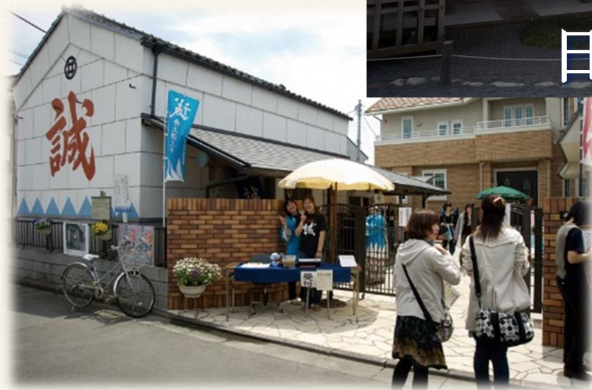
井上源三郎資料館