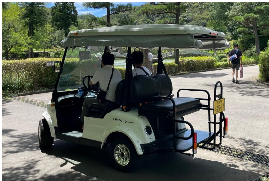
導入予定のグリーンスローモビリティ