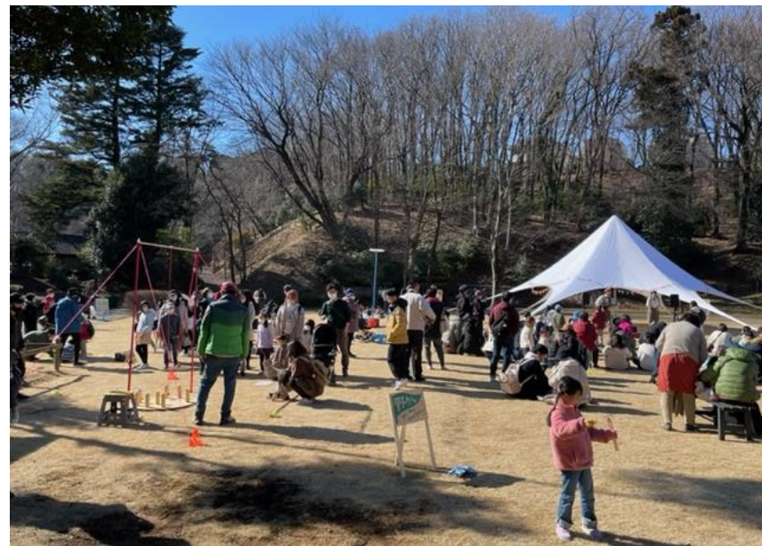
冬の公園活用を提案するイベント