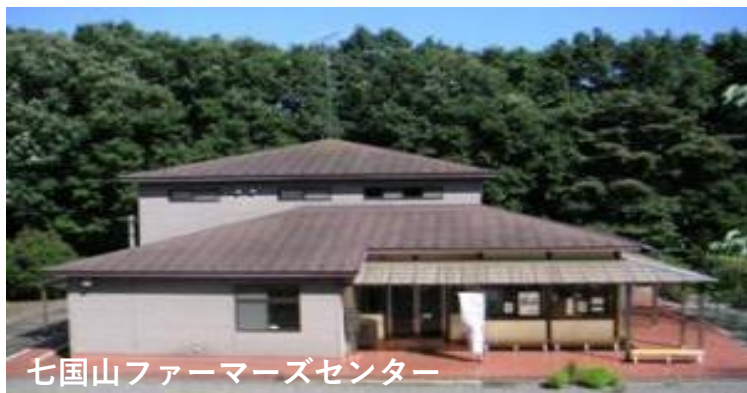
七国山ファーマーズセンター